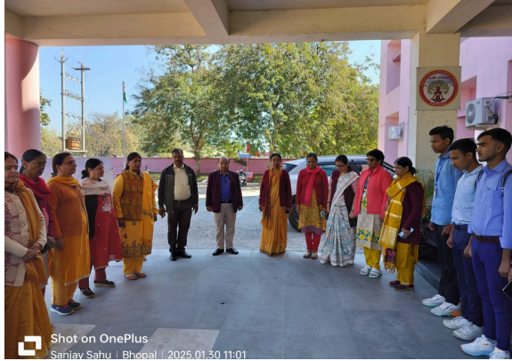
Bhopal | 2025.01.30 11:01