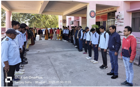
Bhopal | 2025.01.30 11:01

30/01/2025 शहीद दिवस भारत में उन महान स्वतंत्रता सेनानियों को श्रद्धांजलि अर्पित करने के लिए मनाया जाता है, जिन्होंने देश की आजादी के लिए अपना बलिदान दिया और महात्मा गांधी के बलिदान दिवस के रूप में भी जाना जाता है। शहीद दिवस के अवसर पर महाविद्यालय में विभिन्न कार्यक्रमों का आयोजन किया गया। सुबह 10:40 बजे विद्यार्थी एवं स्टाफ एकत्र हुए। सभा की शुरुआत महात्मा गाँधी के प्रिय भजन 'रघुपति राघव राजा राम' के गायन से की गई, महात्मा गाँधी और अन्य शहीदों को पुष्पांजलि अर्पित की गई। 11:00 -11:02 बजे 2 मिनट का मौन रखकर शहीदों को स्मरण किया गया।